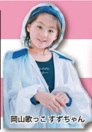
岡山歌っこすずちゃん

お車ご利用の方は、役場付近の臨時駐車場より会場まで徒歩で約5分です。 会場付近に障害者駐車場をご用意しております。係員までお問合せ下さい。