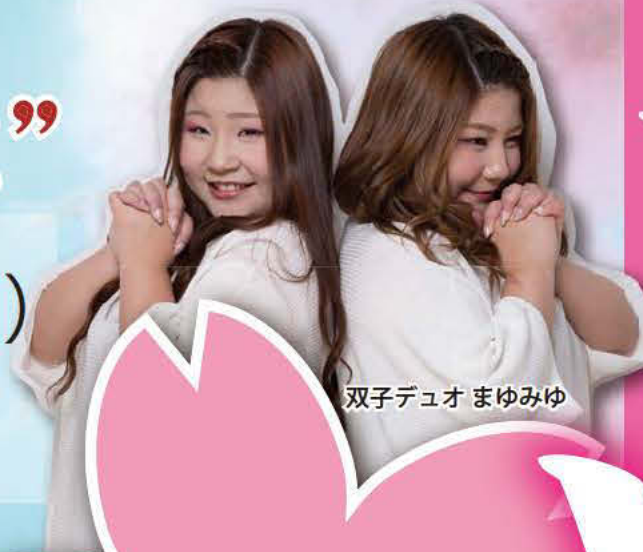
双子デュオまゆみゆ